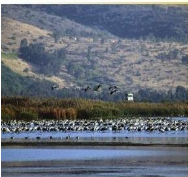
שמורת החולה המשמרת נופי בָּצה, בעלי חיים וצמחייה ייחודית, וכן את תופעת נדידת הציפורים בעונות המעבר

המקומות שאותם משמרים הם נופי טבע ייחודיים ואתרי תרבות בעלי חשיבות היסטורית, דתית, אדריכלית, אמנותית או מדעית. המשותף לכל האתרים הללו שהם מבטאים "מורשת" - כלומר, יש בהם מרכיבים שחשוב, לדעת רבים, לשמור עליהם ולהעבירם מדור לדור. היוזמה לשימור אתרי טבע או תרבות מגיעה מכיוונים שונים: לעתים היא נובעת מ"למטה", כלומר מתושבי היישוב או האזור - ועדים, ארגונים או גופים שפועלים לשמר נכס ראוי בעיניהם; ולעתים היוזמה לשימור מגיעה מ"למעלה", ממוסדות השלטון - הרשות המקומית או השלטון המרכזי, או ממוסדות בין-לאומיים ובראשם מוסדות האו"ם, העוסקים בשימורם ובטיפוחם של אתרים ברחבי העולם. שימור הנופים הטבעיים והאתרים התרבותיים ברמה העולמית התפתח בעיקר משנת 1972, אז הכריז ארגון אונסק"ו* על אָמְנָה לשימור אתרי מורשת עולמית (ראו הרחבה בהמשך).