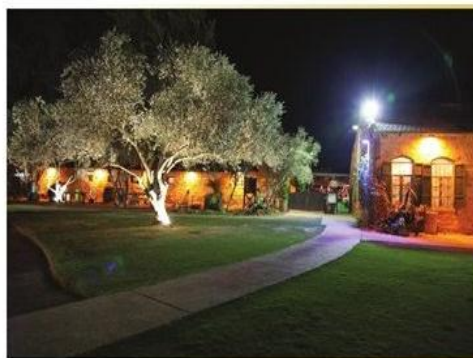
אחוזת דוברובין המשוחזרת ביסוד המעלה האחוזה מספרת את סיפורה המושבה, שעלתה על הקרקע בשנת 1884, ואת סיפורה המיוחד של משפחת דוברובין. זוהי משפחה של גֵּרִים שעלו מרוסיה, התגיירו, רכשו נחלה, והקימו בה בית אחוזה ופיתחו משק חקלאי. בשנת 1986 שוחזרה האחוזה וכיום האתר משלב בין ישן לחדש: חלק מהאחוזה משמש כמוזיאון, וחלק אחר כגן אירועים ומסעדה